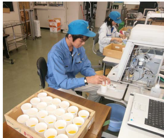
2019年の夏インターンに参加後入社した社員