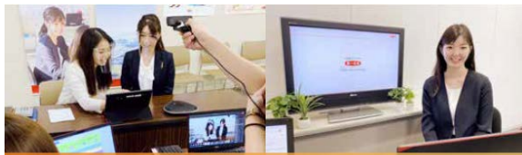
オンラインインターンシップの様子